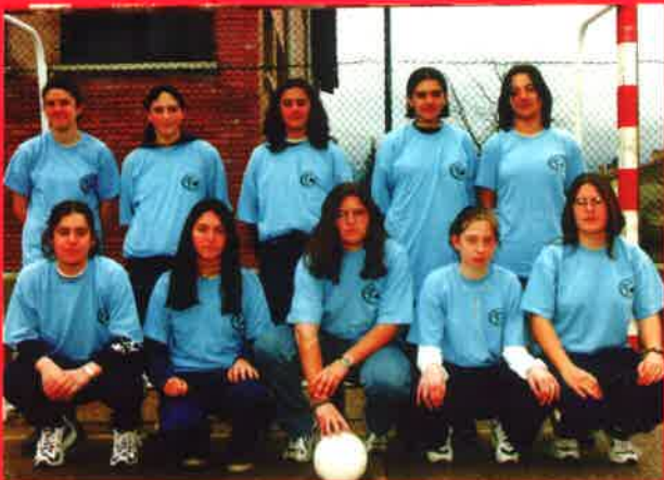
Fútbol sala (juvenil femenino)