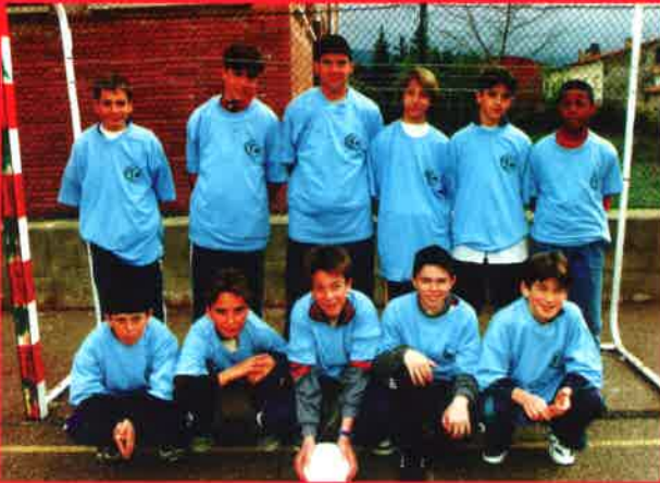
Fútbol sala (infantil masculino)