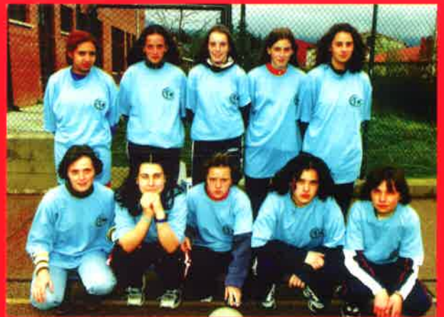
Voleibol (cadete femenino)