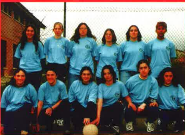
Voleibol (juvenil femenino)