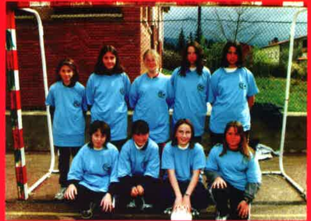
Fútbol sala (infantil femenino)