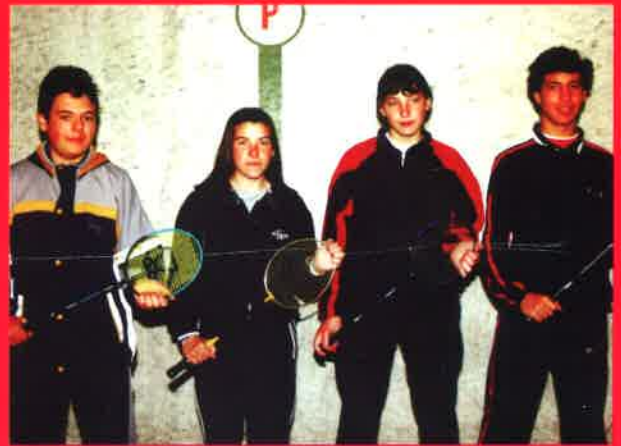
EQUIPO DE BADMINTON