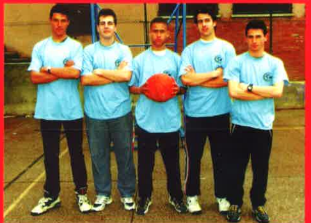
Baloncesto (juvenil masculino)