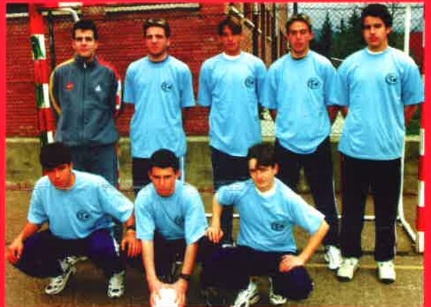
Fútbol sala (juvenil masculino)