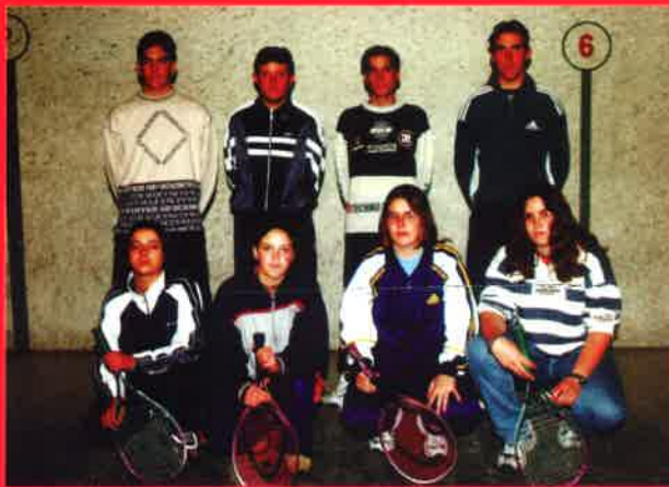
EQUIPO DE FRONTENIS