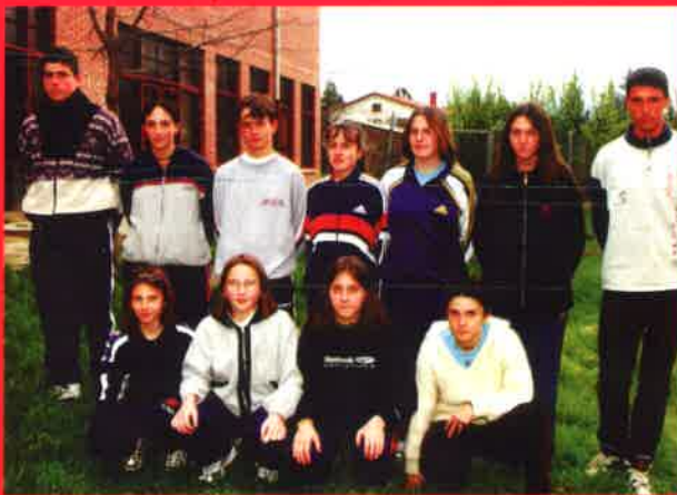
EQUIPO DE ATLETISMO