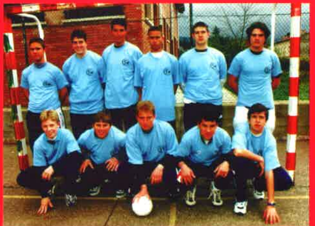
Fútbol sala (cadete masculino)