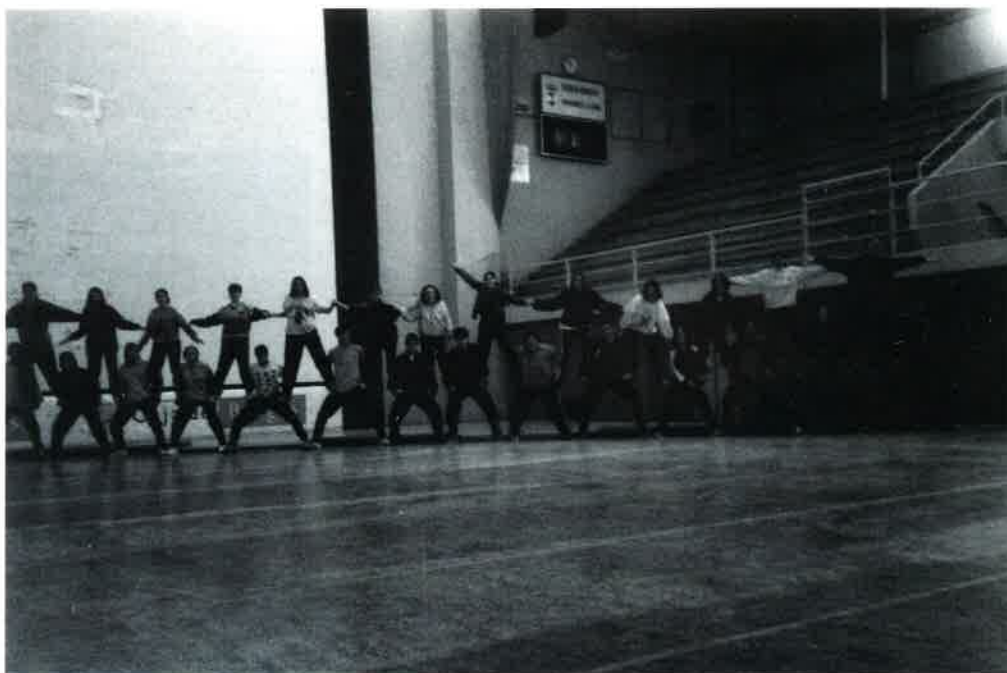
Figura de acrogimnasia. Alumnos de 1º de bachillerato

Desde el Departamento de Educación Física felicitamos a todos los participantes. ■