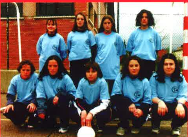
Fútbol sala (cadete femenino)