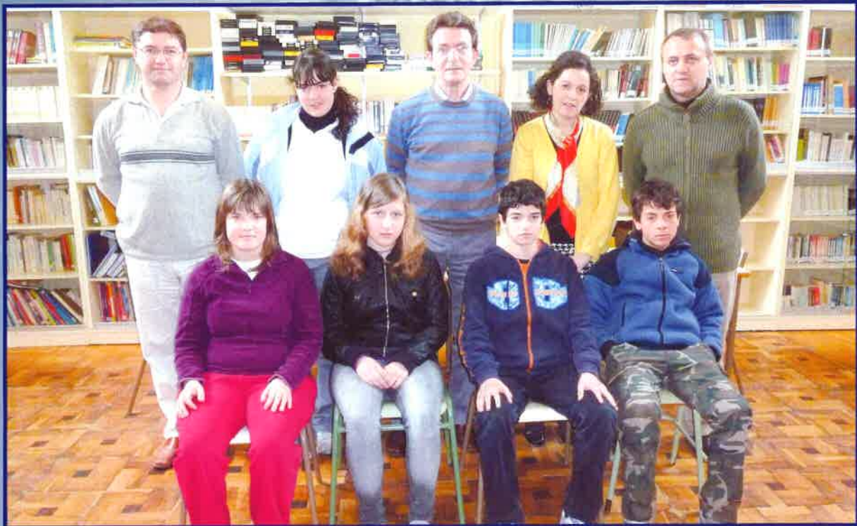
DE IZQUIERDA A DERECHA Y DE ABAJO ARRIBA