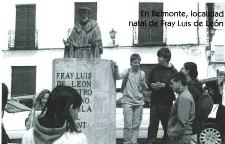
En Belmonte, localidad natal de Fray Luis de León