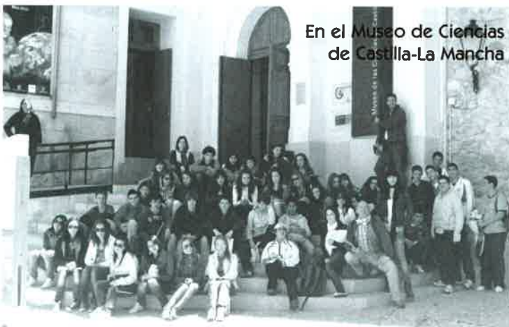
En el Museo de Ciencias de Castilla-La Mancha