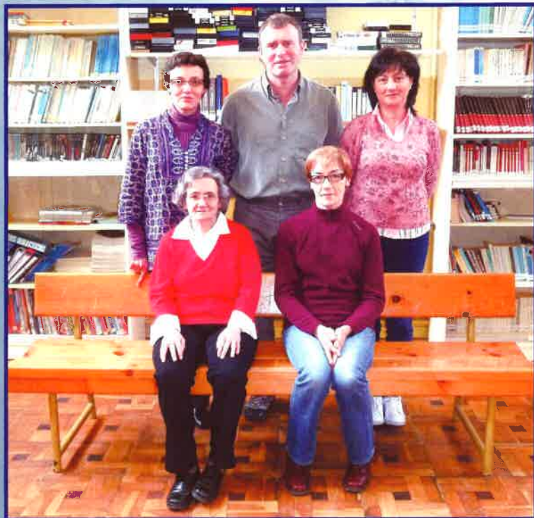
DE IZQUIERDA A DERECHA Y DE ABAJO ARRIBA