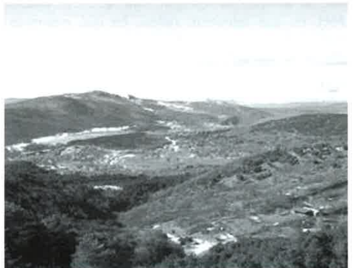
Vista desde el mirador del Berezalón

orientado hacia el oeste, donde se puede ver la diversidad de especies arbóreas como encinas, pinos y el robledal de la Umbría de Palacios (de los más importantes de España), también se distinguen la peña Carazo (Salas), las Calderas y al fondo el alfoz de Lara, tanto en el mirador del Peñón como el del Berezalón son puntos ideales para sacar fotografías.