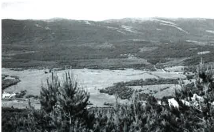
Panorámica desde Mojón Alto

A pocos metros se llega a "Mojón Alto" (límite con Canicosa) desde donde hay una gran vista panorámica con los Picos de Urbión al fondo (fotografía), se