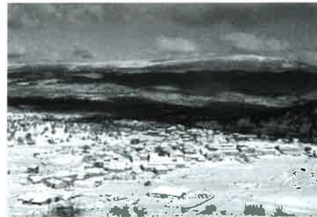
Vilviestre con la Campiña al fondo desde las Cuerdas

emprende un largo descenso por un camino marcado llamado "Cuesta Rasa", lugar por donde muchos habitantes de Vilviestre entre 1944 y 1964 iniciaban a pie el recorrido hasta el "Amogable" (20 Km. de distancia y más de 5 horas de camino) para realizar durante toda la semana trabajos de limpieza de montes y construcción de pistas forestales; en el trayecto iban cargados con la comida para la semana a sus espaldas (el avío).