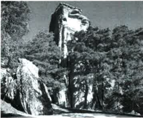
Peña la Torre

700m. de bajada se observan algunos de los pocos robles que quedan en Vilviestre; el horno es de pequeñas dimensiones (1,05 m. de diámetro) y muy cerca de allí está el topónimo del "Veredón de los Muñecos", este nombre es debido a que habitantes del pueblo de Muñecas pasaban por allí con sus mulas hacia Canicosa después de realizar trueques de tercios de pez por cereales y carne con los pezgueros de Vilviestre (la pez la llevaban hasta La Rioja).